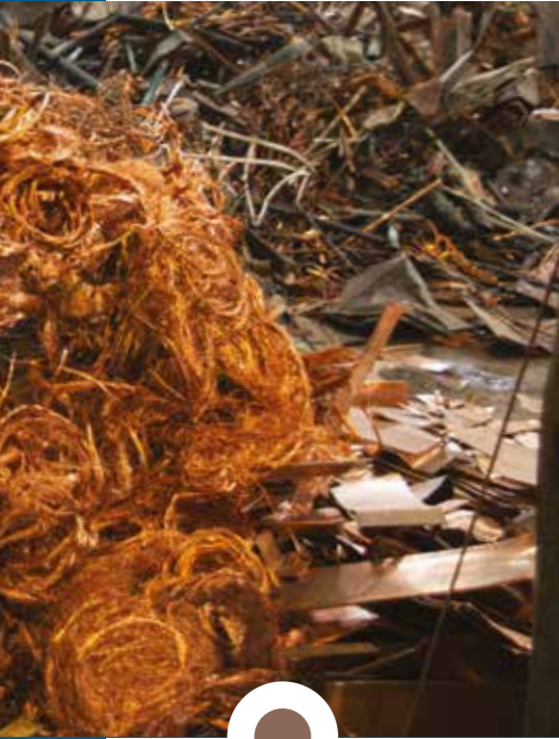
Rottame di RAME