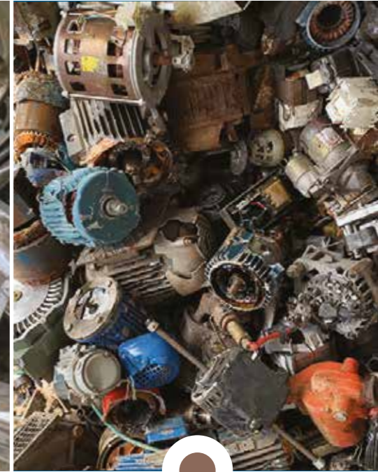
Rottame MOTORI ELETTRICI

Su tutti i metalli sono previsti i seguenti trattamenti per l'ottenimento delle caratteristiche tecniche richieste dalle fonderie/acciaierie che riutilizzeranno il materiale: