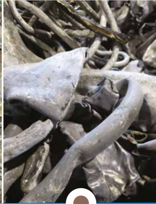
Rottame di PIOMBO