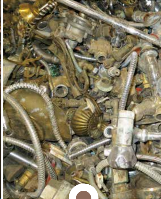
Rottame di OTTONE