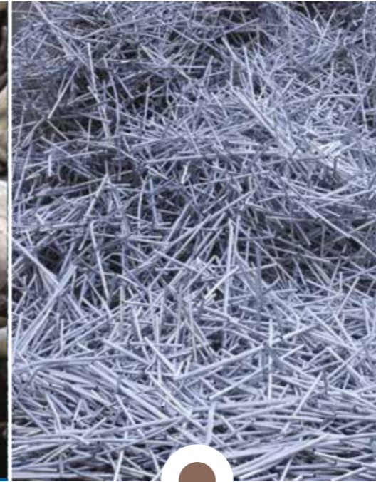
Rottame di ALLUMINIO