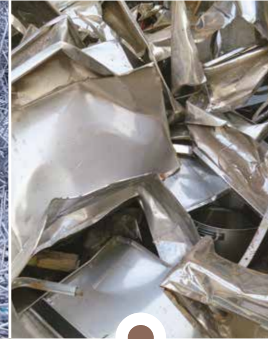
Rottame di ACCIAIO INOX